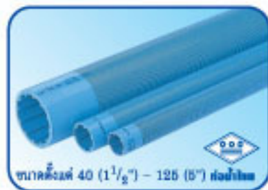
ขนาดตั้งแต่ 40 (1½") - 125 (5") ยาว 10 เมตร