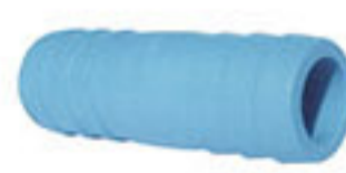
ข้อต่อหางปลาไหล 2 ด้าน