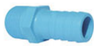
ข้อต่อเกลียวนอกหางปลาไหล