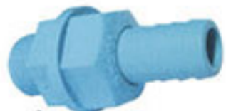
ยูเนียนหางปลาไหลพีวีซี