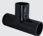
สามทาง 90° ร้อยสาย สีดำ TS TEE FOR PVC CONDUIT